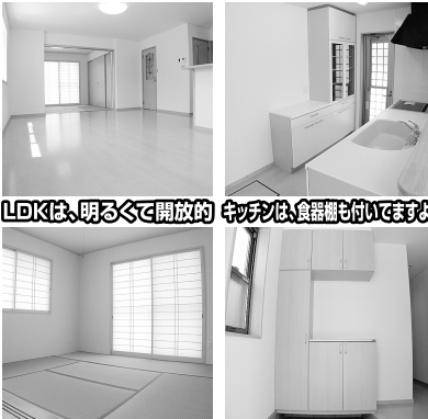
LDKは、明るくて開放的 キッチンには食器棚も付いています

●土地/150.34㎡(45.47坪) ●建物/123.83㎡(37.45坪) ●間取(①)洋12.4、洋6.7、洋6.6、トイレ、洗面、サルルーム、バルコニー、ロフト ②LDK18.2、和6.1、トイレ、洗面、脱、脱4台 ■交通/森戸バス停より徒歩約3分